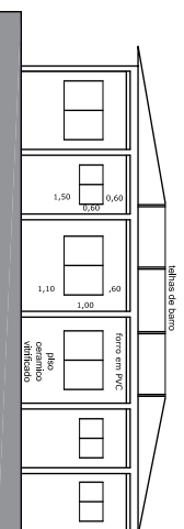
Corte CC Esc 1 / 100